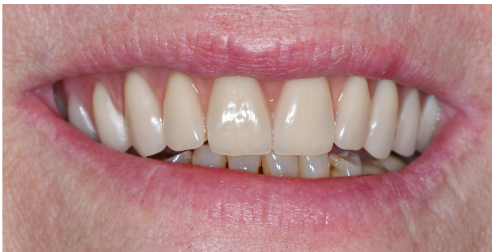
Ejemplo de uso de Mallas Subperiósticas